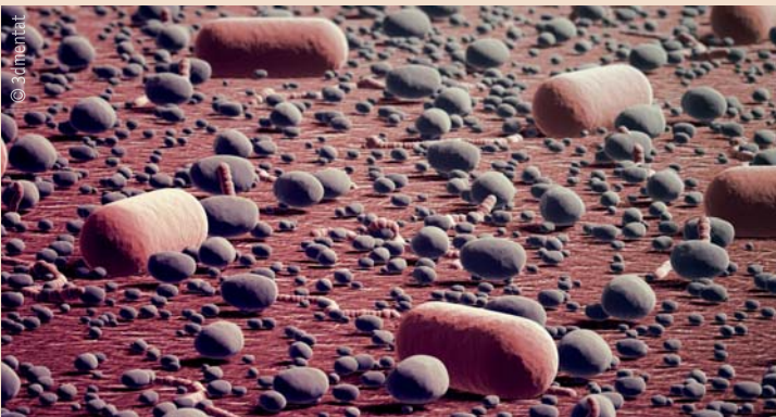
Mikrobenverteilung im menschlichen Biofilm unterscheidet sich von Mensch zu Mensch eindeutig.

Unterschiedliche Verteilung der Mikroben im menschlichen Biofilm.