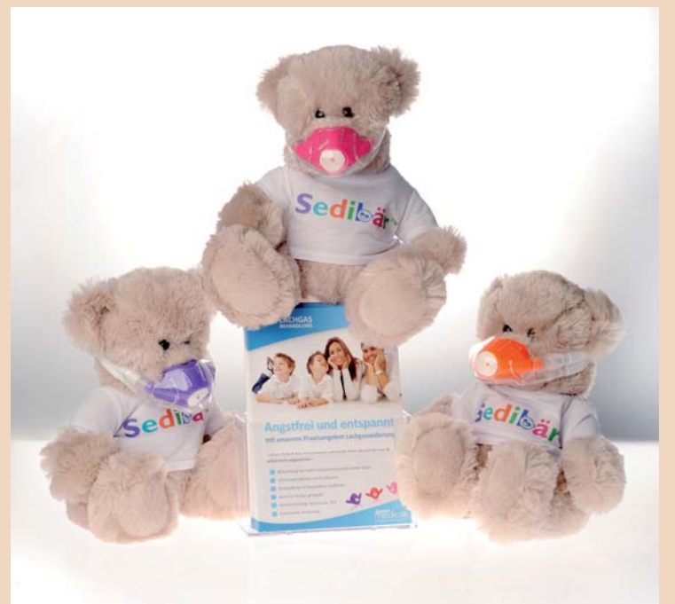
Flyer und Sedibär für Kinder – wertvolle und sinnvolle Hilfestellungen bei der Einführung der Lachgas Sedierung in die Ordination.