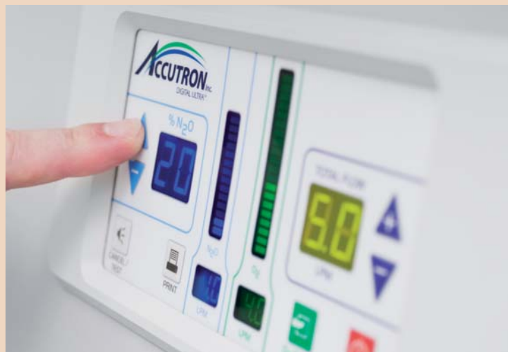
Digitale Lachgastechnik von BIEWER medical – sichere und intuitive Bedienung.