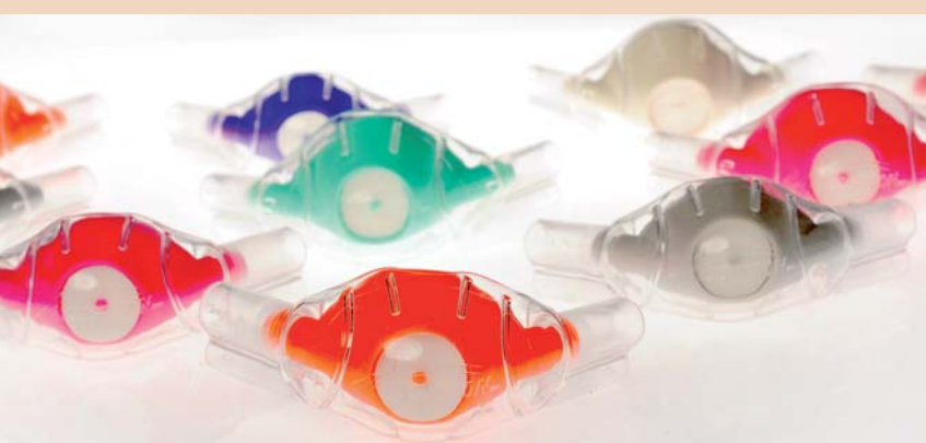
sedaview® – Doppelmaske in verschiedenen Größen und Düften.