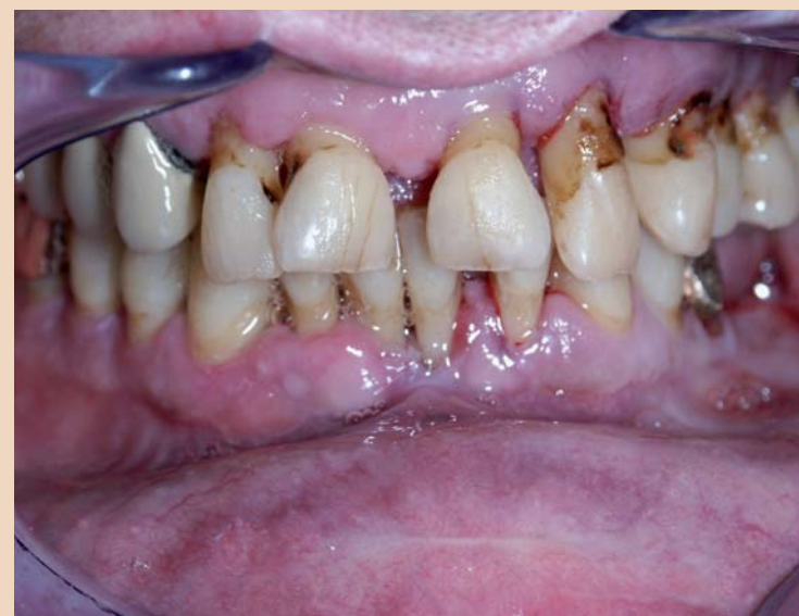
Abb. 1: Klinisches Erscheinungsbild einer unbehandelten Parodontitis bei einem 65-jährigen Diabetiker.

bleibt, so hat ein bestehender Diabetes mellitus in erheblichem Maß Einfluss auf die Krankheitsentwicklung, sodass man die Parodontitis zu den mikrovaskulären Folgeerkrankungen des Diabetes zählen muss.