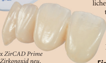
IPS e.max ZirCAD Prime definiert Zirkonoxid neu.

Nur wenige Marken haben es geschafft, den Dentalmarkt zu revolutionieren. IPS e.max ist eine davon. Nun launcht Ivoclar Vivadent IPS e.max ZirCAD Prime – und definiert damit Zirkonoxid völlig neu.