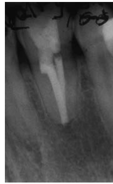
05.09.2000: Fortschreitende Resorption des überstehenden GP.