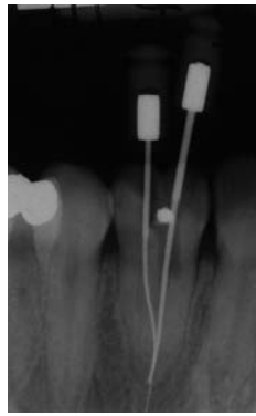
18.04.1995: Mess-Rö mit 29 mm langen Reamern.