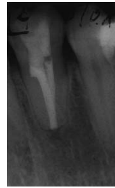
08.05.2001: Kein überstehender GP mehr zu sehen.

diologischen Apex hinausging, woraus eine Überfüllung des Guttaperchastiftes resultierte.