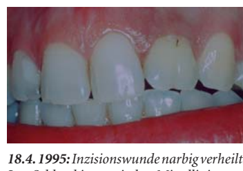
18.4.1995: Inzisionswunde narbig verheilt. Im Schlussbiss typische Mittellinienverschiebung wie bei unilateralem überzähligen oder überbreiten Zahn.