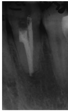
11.12.1998: Fortschreitende Resorption des überstehenden GP.