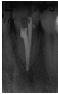
18.04.1995: Kontrollaufnahme der WF: ein GP 1 mm über Apex.