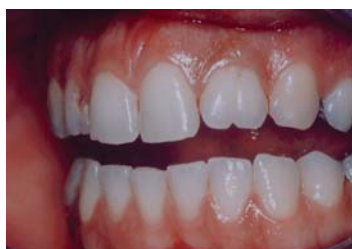
18.4.1995: Sechs Tage nach Trepanation vor Weiterbehandlung.