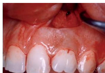
18.4.1995: Inzision und Fistulationsöffnung.