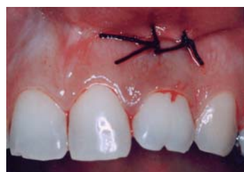
18.4.1995: Zwei Nähte zum Verschliessen der Inzision.