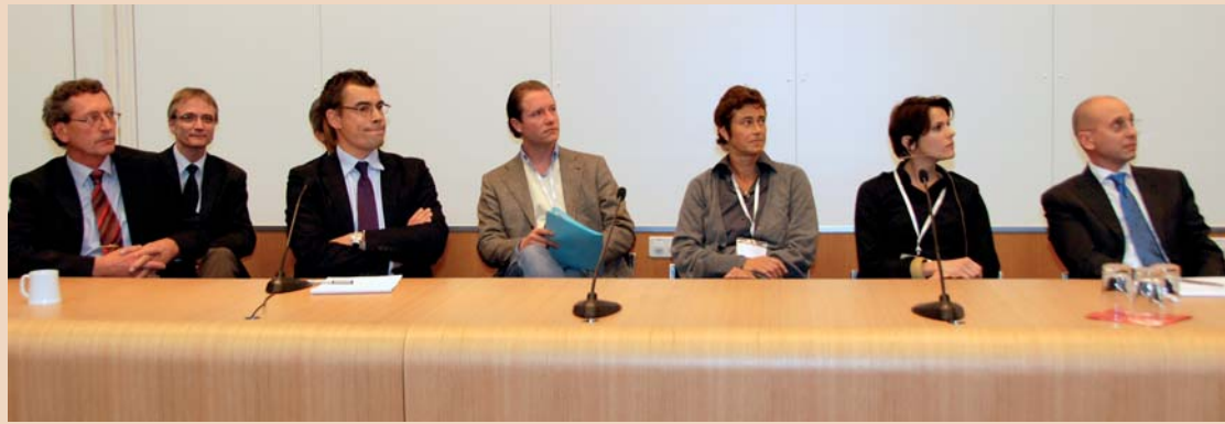
Panel-Diskussion am Ende der Veranstaltung

In einer spannenden Panel-Diskussion am Schluss der Veranstaltung wurden alle Themen des Tages noch