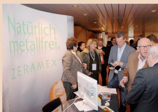
Grosses Interesse am Stand der Zeramex.