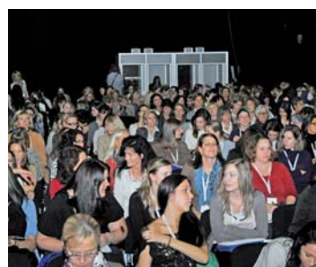
Über 1'000 Teilnehmerinnen folgten den Referaten in der OLMA-Halle 9 in St. Gallen.