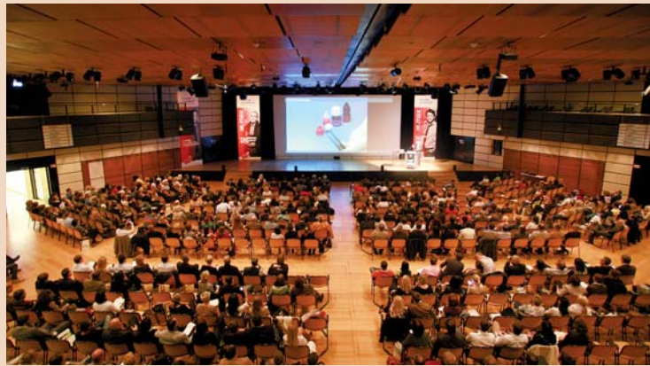
Blick ins Auditorium.