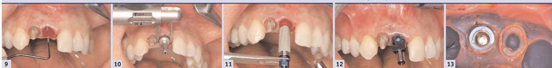
Abb. 9: Mit der Parodontalsonde wird die Alveole zusätzlich sondiert, um eventuelle Defekte am Alveolenrand zu erkennen. Auch die Gingivahöhe wird analysiert, um zukünftige Resorptionen abschätzen zu können. – Abb. 10: Mit dem in die Alveole eingesetzten Formbohrer können die geplante Implantatachse und die Abstände zu benachbarten Strukturen überprüft werden. – Abb. 11: Insertion eines Camlog® Screw-Line Promote® Implantats mit 5 mm Durchmesser und 16 mm Länge. – Abb. 12: Abformung mit einem Abformpfosten, offener Löffel, zur Anfertigung des „Early-Abutments“ und Langzeitprovisorioms. – Abb. 13: Detailansicht der Abformung zur präzisen Übertragung der Implantatposition auf das Modell.