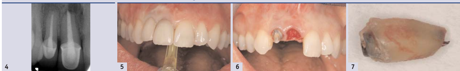
Abb. 4: An Zahn 11 ist ein alio loco eingebrachter Metallstift erkennbar. Die WSR ist nicht ausgeheilt. Die Wurzelkanalfüllung an Zahn 12 erscheint apikal zu kurz. – Abb. 5: Um Zahn 11 zu entfernen, wurde mit einem computergesteuerten Injektionsgerät (The Wand, Milestone) ausschliesslich palatinal injiziert. Dabei wird das vernarbte Gewebe kaum traumatisiert und die Blutversorgung nicht unterbunden. – Abb. 6: Schonende Entfernung des Wurzelrests 11. Das entzündliche Gewebe wurde vollständig ausgeschabt. – Abb. 7: An der entfernten Wurzel ist apikal der Metallstift erkennbar. – Abb. 8: Entscheidend bei der Sofortimplantation ist die exakte Ausmessung der Alveole. Nur so kann erkannt werden, wo sich Knochen befindet und ob dieser intakt ist. Mit einer Schublehre (Zepf Medizintechnik) wird der Implantatdurchmesser bestimmt.