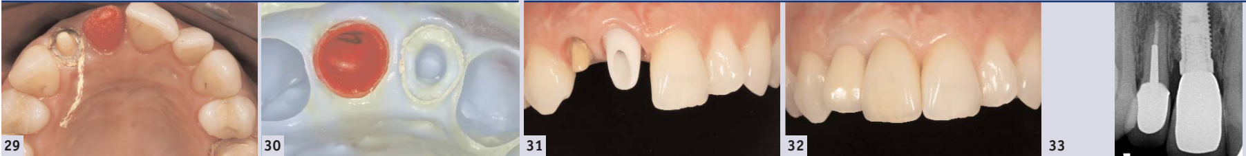
Abb. 29: Abformung des definitiven Abutments und des natürlichen Pfeilers zur Herstellung der definitiven vollkeramischen Restaurationen. – Abb. 30: Die Position des Abutments wird mithilfe eines Kunststoffkappchens auf das Modell übertragen. – Abb. 31: Zwölf Monate post Op ist das Gewebe maturiert und die Gingivarezession minimal. – Abb. 32: Zwölf Monate post Op werden die definitiven vollkeramischen Kronen eingesetzt; die Zahnstellung wurde den kontralateralen Zähnen angeglichen. Es wurde darauf geachtet, die Papille zwischen 11 und 21 nicht zu quetschen. – Abb. 33: Röntgenkontrolle ein Jahr nach Belastung.