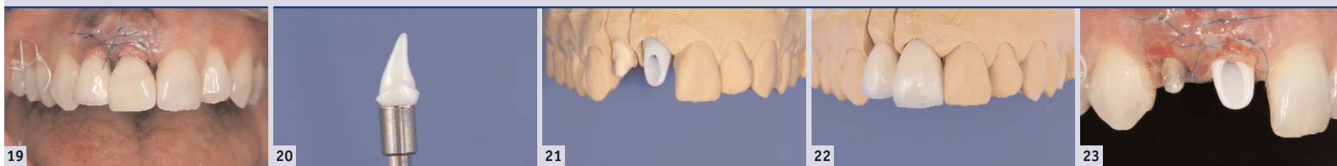
Abb. 19: In der Zwischenzeit wurde das Provisorium im Labor ausgearbeitet; es kann nach Einschrauben des Titan-Abutments zementiert werden. – Abb. 20: Innerhalb von zwei Tagen wurde ein Keramik-Abutment auf einer Titan-klebebasis angefertigt. Die Zirkoniumdioxidkeramik weist im Sinne des Platform Switching einen geringeren Durchmesser auf. – Abb. 21: Das definitive, auf dem Laborimplantat verschraubte Abutment. – Abb. 22: Das Langzeitprovisorium Regio 11 wurde mit der Krone auf dem natürlichen Stumpf verblockt. – Abb. 23: Zwei Tage post Op: Das provisorisch eingesetzte Titan-Abutment wird gegen das definitive Keramik-Abutment ausgewechselt.