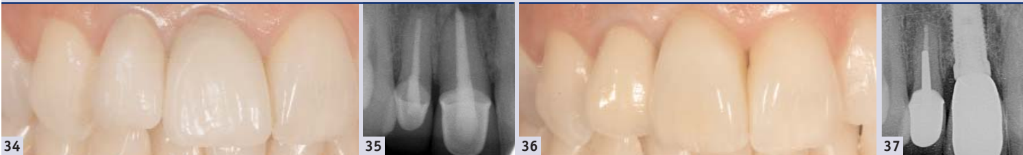
Abb. 34: Ausgangssituation mit den beiden wurzelbehandelten Zähnen Regio 11 und 12. An Zahn 12 wurde zudem eine Wurzelspitzenresektion durchgeführt. Die hohe Lachlinie und der dünne gingivale Phänotyp erschwerten den Fall erheblich. – Abb. 35: An Zahn 11 ist ein alio loco eingebrachter Metallstift erkennbar. Die Wurzelspitzenresektion ist noch nicht vollständig ausgeheilt. Die Wurzelkanalfüllung an Zahn 12 erscheint apikal zu kurz. – Abb. 36: Die Situation zwei Jahre nach Sofortimplantation und ein Jahr nach der definitiven prothetischen Versorgung. – Abb. 37: Röntgenkontrolle fünf Jahre nach Belastung.