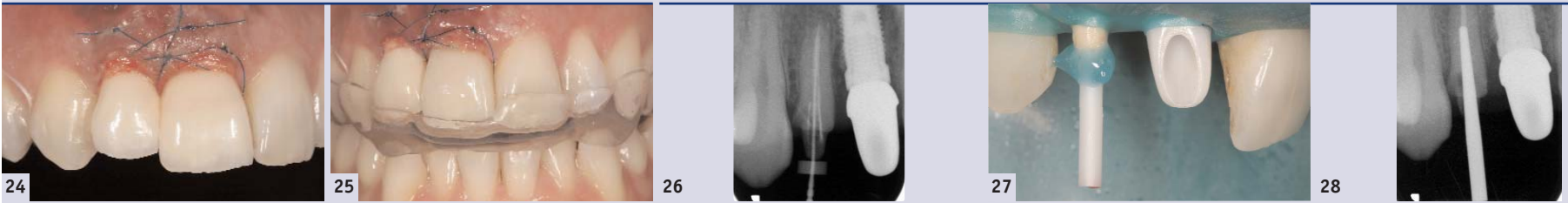
Abb. 24: Das Langzeitprovisorium wird befestigt; es verbleibt für mindestens sechs Monate, in diesem Fall sogar für zwölf Monate, in situ. – Abb. 25: Eine Michigan-Schiene schützt das Operationsgebiet vor Druck. Sie sollte mindestens vier Wochen lang beim Essen und Schlafen getragen werden. – Abb. 26: In Regio 12 wird die Wurzelkanalbehandlung revidiert. – Abb. 27: Nach der revidierten Wurzelkanalbehandlung und einem internen Bleaching wurde ein Keramikstift in den Wurzelkanal eingepasst und eingeklebt. – Abb. 28: Röntgenologische Kontrolle des eingebrachten Keramikstifts.