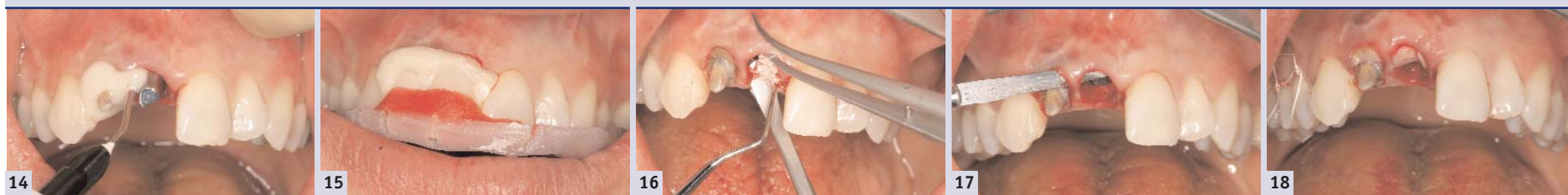
Abb. 14: Unterfütterung eines Schalenprovisorioms auf einem intraoral markierten und im Labor individualisierten Titan-Abutment. Bei geringer Höhe ist Titan wegen seiner hohen Stabilität besser geeignet als PEEK. – Abb. 15: Das Schalenprovisorium wird mithilfe eines Einsetzschlüssels positioniert. – Abb. 16: Für den Knochen- und Weichgewebsaufbau sollte der labiale Spalt zwischen Implantat und Alveole mit einem nicht resorbierbaren Knochenersatzmaterial aufgefüllt werden. – Abb. 17: Das Weichgewebe wird mit einem freien subepithelialen Bindegewebstransplantat verdickt. Eine Pouch ohne Vertikalinzision und unter Schonung der Papillen wird präpariert. – Abb. 18: Bindegewebstransplantat in situ; wichtig ist, dass die Papille intakt bleibt.