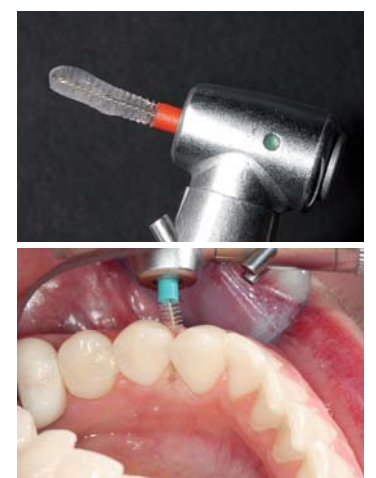
Nachhaltige Wirkung, exakte Anwendung, perfekter Schutz: CURASEPT ADS® 1% Parodontal-Gel im Praxiseinsatz am grünen Winkelstück.