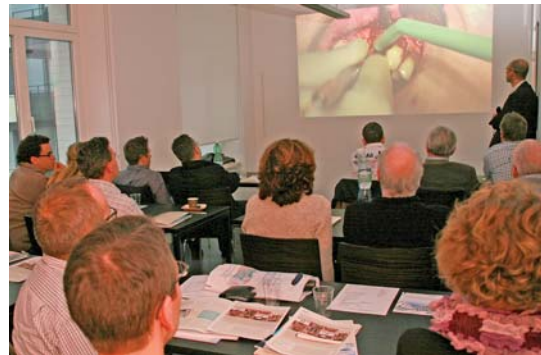
Die Knochenringtechnik begeisterte 40 Teilnehmer.

Erfolgsrate von über 98 % präsentiert er diese Technik als eine der zuverlässigsten Augmentationsmethoden, sofern das Step-by-Step-Protokoll auch genau befolgt wird.