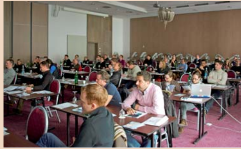
Gut besuchtes 7. Dentalpin Skiweekend in Davos der Fortbildung Zürichsee.

Für die richtige Behandlung braucht es eine gute Diagnostik. Ausstrahlende Schmerzen bei einer Pulpitis sind nicht selten, doch auch diese gilt es zu interpretieren. Des Weiteren gibt es auch chronische Schmerzen, welche immer wieder mit Zähnen in Verbindung gebracht