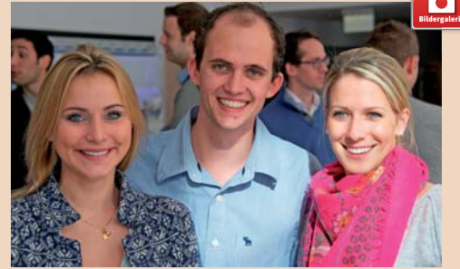
Die Teilnehmer waren zufrieden mit dem gebotenen Programm.

werden. Für die Entscheidung zur Pulpaexstirpation braucht es aber eine eindeutige Ursache und Schmerzen müssen reproduzierbar sein. Auch Wurzelfrakturen können diagnostisch zur Herausforderung werden, doch hier kann meistens nur ein dokumentierter Verlauf der Knochenläsion Aufschluss geben. Notfallbehandlungen müssen an das diagnostische Konzept angepasst werden. So ist bei fortgeschrittener Infektion mit einer apikalen Parodontitis ein sauberes Aufbereiten und Spülen