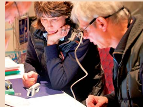
Reges Interesse an der Dentalausstellung. Während den Pausen konnten verschiedene Endo-Geräte ausprobiert werden.