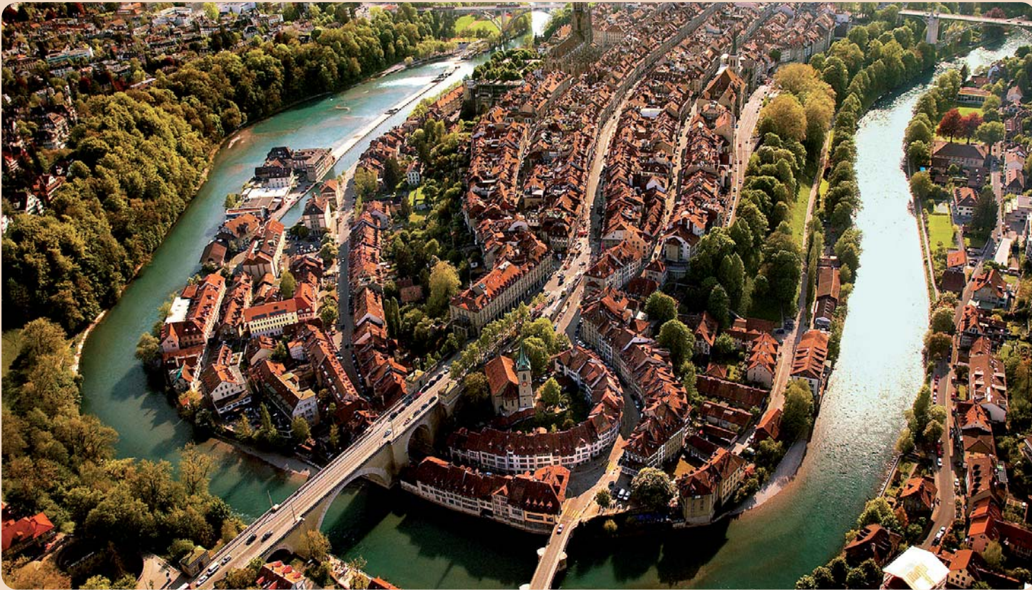
Blick auf die Berner Altstadt, umrahmt von der Aare.

In der BERNEXPO findet vom 14. bis 16. Juni der SSO-Kongress und die DENTAL 2012 statt.