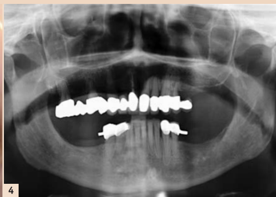
Abb. 1: BP-ONJ Stadium I. – Abb. 2: BP-ONJ Stadium II. – Abb. 3: BP-ONJ Stadium III. – Abb. 4: Panoramaschichtaufnahme einer Patientin mit einer monoklonalen Gammopathie unklarer Signifikanz, die bereits seit mehreren Jahren mittels Bisphosphonaten behandelt wird. In der Panoramaschichtaufnahme erkennt man bisphosphonattypische Veränderungen, wie eine honigwabentartige veränderte Struktur der Spongiosa mit Skleroseerscheinungen. Besonders imponant ist die verdickte Lamina dura besonders im Unterkiefer.

Bisphosphonate werden bei benignen Knochenstoffwechselstörungen, dem multiplen Myelom und ossären Metastasen solider Tumore verabreicht. Alleine in Deutschland leiden zwischen