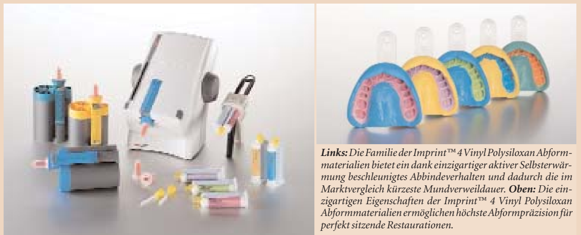
Links: Die Familie der Imprint™ 4 Vinyl Polysiloxan Abformmaterialien bietet ein dank einzigartiger aktiver Selbsterwärmung beschleunigtes Abbindeverhalten und dadurch die im Marktvergleich kürzeste Mundverweildauer. Oben: Die einzigartigen Eigenschaften der Imprint™ 4 Vinyl Polysiloxan Abformmaterialien ermöglichen höchste Abformpräzision für perfekt sitzende Restaurationen.

Das Erzielen einer präzisen Abformung ist stark vom Grad der Detailwiedergabe abhängig, der wiederum vor allem von der Hydrophilie des Abformmaterials beeinflusst wird. Ein extra entwickelter Hydrophilieverstärker ist für das neuartige super-hydro-