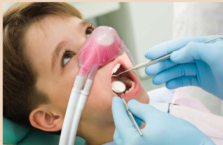
sedaview® – die einzigartige Doppelmaske von BIEWER medical.

kann man solche fast vollständig ausschliessen. Zudem verhindern moderne Geräte eine versehentliche Überdosierung. Die orale Sedierung ist bei einem gut ausgebildeten Zahnarzt ebenfalls eine sichere Methode. Probleme treten dann auf, wenn schlecht ausgebildete Zahnärzte anästhesiologisch überfordert sind. Beide Methoden bedürfen einer fundierten Ausbildung durch Fachärzte nach den geltenden Richtlinien. Ein bisschen Schnupperkurs reicht da nicht.