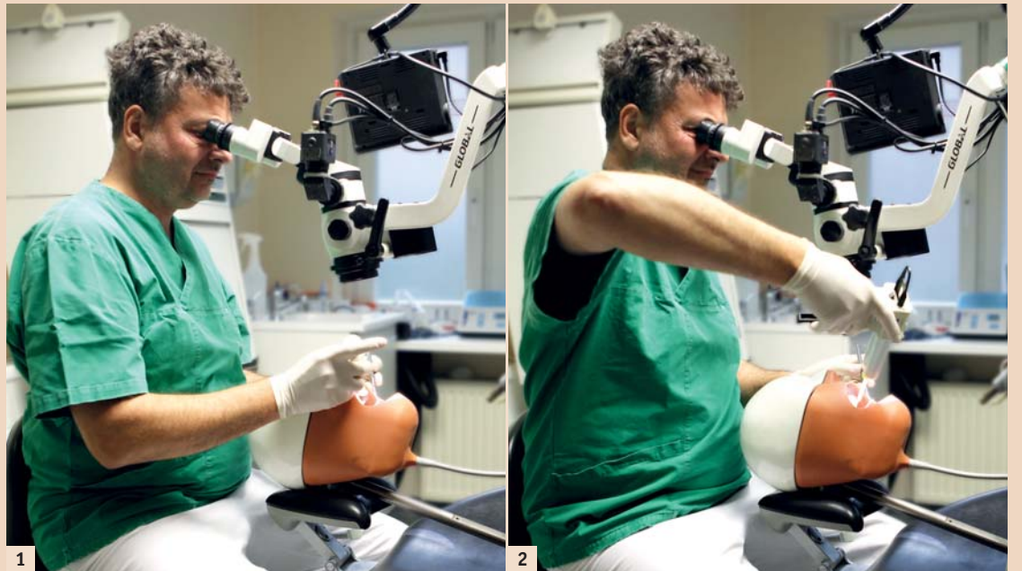
Abb. 1 und 2: Die Verwendung verschiedener Behandlungsinstrumente hat Einfluss auf Sitzposition und Haltung. Hier die physiologische (Abb. 1) und unphysiologische Haltung (Abb. 2) beim Umspritzen des Sulkus.

Wie kann das Praxisteam Arbeitsprozesse systematisch und zielorientiert gestalten, um möglichst physiologisch und belastungsarm ein gutes Behandlungsergebnis zu erreichen? Betrachten wir dies einmal, losgelöst von der Vielzahl der Praxisprozesse, am Beispiel der Präzisionsabformung, einem der schwierigsten und sensibelsten Momente bei der Fertigung von Zahnersatz. Hierbei stellt sich die Weiche für die spätere Passung der Versorgung. Das Ziel für das Praxisteam und das Dentallabor ist eine ideale Darstellung der Mund-