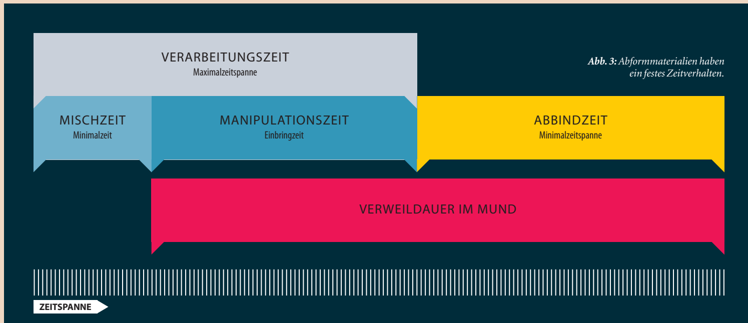
Abb. 3: Abformmaterialien haben ein festes Zeitverhalten.

fließen der Materialien in diese Richtung. Der Abformträger verbleibt bis zum Aushärten in dieser Position und wird erst nach Ablauf der im Protokoll hinterlegten Abbindezeit entfernt.