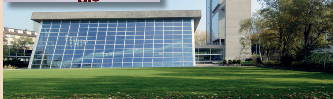
Das Kongresshaus in Biel ist Veranstaltungsort des Jahreskongresses der SGI.