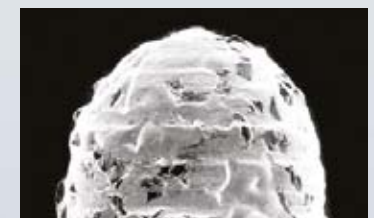
Benutzte galvanisierte Bohrerspitze