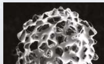
Neue Two Striper ® Bohrerspitze