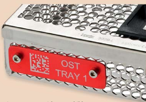
Die neuen Kennzeichnungsschilder für das STERI-WASH-TRAY System.

Das STERI-WASH-TRAY System ist eine vollständige Neuentwicklung für die maschinelle Aufbereitung von Instrumenten aus dem Hause Carl Martin – Solingen.