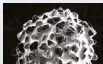
Neue Two Striper ® Bohrerspitze