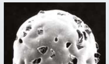
Neue galvanisierte Bohrerspitze