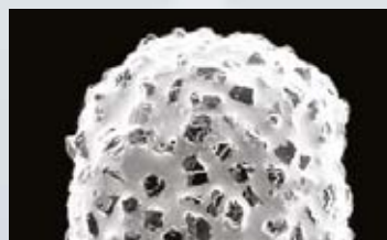
Benutzte Two Striper ® Bohrerspitze