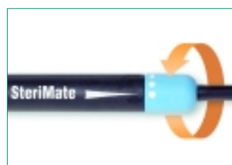
Um 360° Grad drehbares Verbindungsteil.

in Betrieb befindliche Geräte Nachrüstsätze erwerben. Darüber hinaus tauscht Dentsply DeTrey bei zur Reparatur gegebenen Geräten die herkömmlichen Kabel kostenlos gegen die neue benutzerfreundlichere Version aus. Dieses praktische Swivel-Kabel kann sich nicht mehr verwickeln, da ein neues Verbindungsteil zwischen Kabel und Handstück, das um 360° drehbar ist, entwickelt wurde. Ein „Swivel-Kabel“ ist also ein Kabel mit drehbarem Verbindungsstück. So wie ein Bürostuhl („swivel chair“) mit nicht mehr starrem, sondern drehbarem Fuß