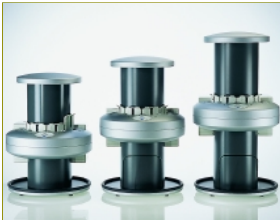
* Sämtliche Mitglieder der VistaScan-Familie verbinden moderne Digitaltechnik mit konventionellem Handling.

Die Einführung des VistaScan von Dürr Dental stellte vor etwas mehr als einem Jahr ein Meilenstein im Bereich der Röntgentechnologie dar. Die digitalen Bilder stehen dabei den konventionellen Aufnahmen in nichts nach – und dies bei gewohntem Handling. Inzwischen ist der Speicherfolien-Scanner vielen Zahnärzten ein Begriff. Weit weniger bekannt ist, dass sich hinter dem VistaScan eine ganze Produktfamilie mit unterschiedlicher Ausstattung verbirgt: „Intra“, „Combi“, „Ceph“ und „Omni“.