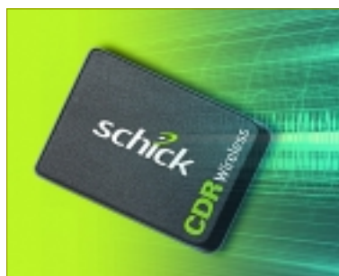
* Der neue Sensor von Schick ist weltweit der erste kabellose Funksensor.

Den weltweit ersten kabellosen Funksensor bringt orangedental als Exklusivpartner von Schick Technologies Inc. auf den deutschen Markt. Der neue Schick-Sensor