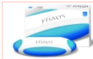
* VISALYS® 7,5 – sichere und zeitsparende Anwendung.

burg). Eine schonende Rezeptur, komfortable und einfache Anwendung sowie beständig hohe Wirkung bei langer Haltbarkeit zeichnen das neue Produkt aus (durchschn. Tragedauer 12 Tage bei tgl. 2 x 30 Min.). Es wird ausschließlich über Zahnärzte angeboten. VISALYS® Whitening entfaltet seine aufhellende Wirkung auf schonende Weise. Denn durch den Zusatz von