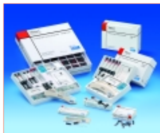
* Venus – Qualität mit 27-Farb-Spektrum.

das Composite perfekt an die natürliche Zahnfarbe anpassen. Zur IDS wurde das Universalcomposite durch ein entsprechendes Bondingsystem und eine darauf abgestimmte Polymerisations-Lampe ergänzt. Mit dem selbst-ätzenden und lichterhär- tenden Ein-Komponenten-Adhäsiv iBond kann der Zahnarzt in nur einem Arbeitsschritt ätzen, primen, bonden und desensibilisieren. iBond eignet sich zur