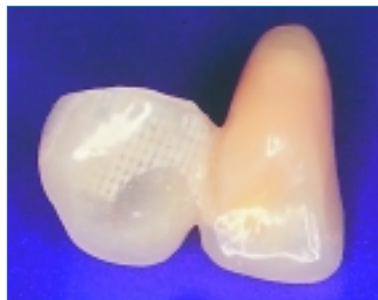
➤ Faserverstärkte Krone mit Anhänger.