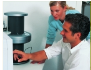
* Egal für welche Variante des VistaScan sich der Zahnarzt entscheidet – Dürr bietet die Vistacademy-Anwenderschulung „Digitales Röntgen“ an.

exakt den verschiedenen Ansprüchen und Bedürfnissen der Zahnarztpraxen entspricht. So enthält der VistaScan „Combi“ neben der üblichen Ausstattung wie Wandhalter, Folienkassetten und ReSetter zur wiederholten Benutzung der Folie auch noch zusätzlich 6 intraorale Speicherfolien in zwei unterschiedlichen Formaten sowie entsprechende Lichtschutzhüllen. Das Paket VistaScan „Ceph“ beinhaltet wiederum eine zusätzliche Ceph-Speicherfolie. Die Ausführung „Omni“ ist über die gängigen dentalen Formate hinaus sogar auch für das Extra-Format 24x30 geeignet und beinhaltet