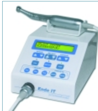
Endo IT professional, für alle wichtigen NiTi-Systeme.

meisten verbreitete NiTi-System. Es nutzt die Effizienz der bewährten Schneidkanten Typ „K“, einen konvexen Querschnitt zur Stabilisierung des Instrumentenkerns und eine auf die rotierende Anwendung abgestimmte Schneidenwinkelung. Je nach Kanalgröße stehen drei von erfahrenen Endodontisten entwickelte und klinisch erprobte Sequenzen zur