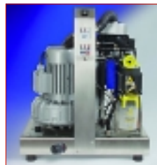
↑ METASYS EXCOM – zuverlässiger Partner bei täglicher Arbeit.

METASYS EXCOM besticht in der gewohnten METASYS-Qualität: Die bestens be-