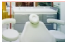
↑ Ritter® ist auf dem richtigen Weg – das hat der Erfolg gezeigt.

tierte Basis für das Jahr 2004 geschaffen. Unter vollen Segeln und mit einem motivierten Team wird Ritter® auch in diesem Jahr für Zahnärzte und Depots viel bewegen. Um das zu erreichen, wurde eine neue Firmen- und Mitarbeiterstruktur im Unternehmen umgesetzt und eine neue kundenorientierte Produktstrategie