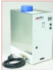
↑ Höchster Qualität beim Trinkwasserschutz gerecht werden.

Obwohl unwahrscheinlich, dass verunreinigtes Wasser in das Trinkwassersystem zurückfließt, bleibt ein Restrisiko (Unterdruck mit Wasserentzug beim Entleeren der Leitungen z. B. durch Rohrbruch). Bisher wurde versucht, diese Gefahr durch ein Rückschlagventil zu verhindern. Wegen möglicher unzureichender Funktion durch