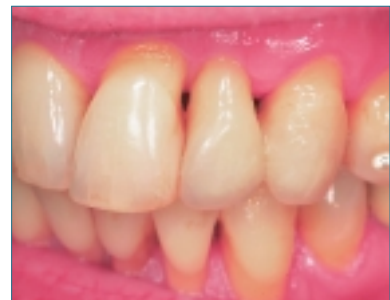
➤ Das ästhetische Ergebnis.

Silanisierte Glasfasern zur Verstärkung von Kunststoffen sind nichts Neues. Sie konnten sich auf Grund verschiedener Nachteile nicht durchsetzen.