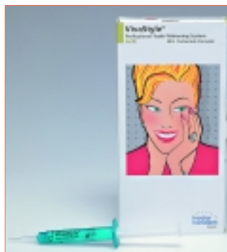
* VivaStyle 30% verspricht eine kurze Behandlungsdauer und schnelle Ergebnisse.

Office-Behandlung dar. Die Applikation des VivaStyle-Gels erfolgt mit Hilfe individuell hergestellter Trays. Während das Gel seine Wirkung entfaltet, kann der Patient entspannt im Wartezimmer sitzen. So steht die Behandlungseinheit in dieser Zeit anderweitig zur Verfügung. Normalerweise ist die Aufhellung schon nach einer Behandlung sichtbar. Entsprechend den individuellen Bedürfnissen können Sie Patienten helfen, die schnell Ergebnisse und eine kurze Behandlungsdauer