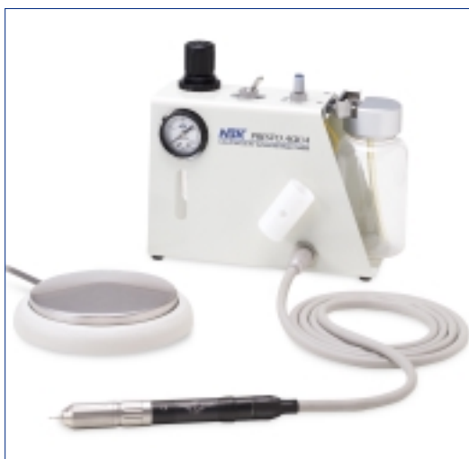
★ Presto-Aqua-System von NSK – arbeiten ohne Schmieren.

Das Handstück ist drehbar und erlaubt einen einfachen Werkzeugwechsel. Es arbeitet zudem geräuscharm und vibrationsfrei. Auch der Ein- und Ausbau des Wasserbehälters ist schnell und unkompliziert möglich. Das Presto-Aqua-System besteht aus dem Presto-Aqua-Ge-