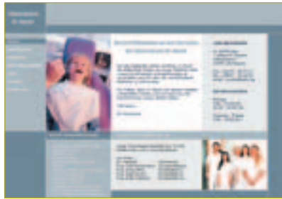
Individuelle Homepage mit dem CMS von DAMPSOFT.

Ein erstes entsprechendes Zahnarztpraxis-CMS wird seit dem Mai von dem Unternehmen DAMPSOFT zur Verfügung gestellt,