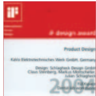
▲ iF design award 2004.

Dank seiner herausragenden Verbindung zwischen modernem Aussehen (by