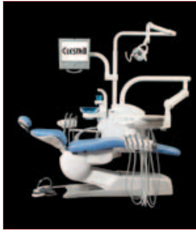
▲ CLESTA II – Synthese aus Tradition und Fortschritt.

Der Patientenstuhl CLESTA II ist mit dem seit Jahrzehnten bewährtem