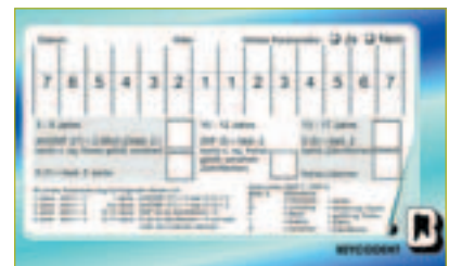
IP 4 ermöglicht zwei Abrechnungen pro Kalenderjahr.

Mit den neuen Aufklebern wird eine kurze Anleitung über die Dokumentation gleich mitgeliefert. Es besteht somit problemlos die Möglichkeit, bei den entsprechenden Patienten eine zweimalige Abrechnung IP 4 (12 Punkte) innerhalb eines Kalenderjahres vorzunehmen. Die Abrechnungsmöglichkeit und Dokumentation gilt für Versicherte bis zur Vollendung des 18. Lebensjahres.