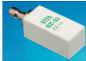
▲ VITA In-Ceram BLANKS ZIRCONIA für Brückengerüstestärke.

rianten auch VITA In-Ceram BLANKS: ein innovatives Vollkeramik-System, das mit unterschiedlichen CAD/CAM-Technologien effizient und ökonomisch verarbeitet werden kann. Durch die industrielle Herstellung des Blockmaterials in einem kontrollierten und standardisierten Fertigungsprozess wird die konstante Qualität und damit auch die klinische Sicherheit der weltweit erprobten VITA In-Ceram-Werkstoffe gewährleistet. Zudem ist das Blockmaterial stärker versintert und erreicht so in der späteren Verarbeitung eine nochmals gesteigerte Festigkeit. Die VITA In-Ceram BLANKS