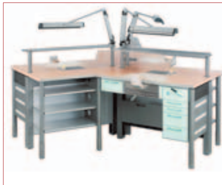
▲ Gewinner des „iF design award 2004“ – die KaVo FLEXspace®.

Insgesamt erhielten dieses Jahr 513 von 1.458 Anwärtern das iF Label für hervorragende Gestaltungsqualität. FLEXspace® nahm in der Disziplin „Product Design“ am Wettbewerb teil.