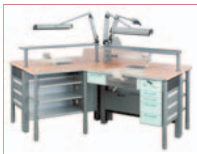
^ Gewinner des „iF design award 2004“ – die KaVo FLEXspace®.

Die neue KaVo Laboreinrichtungslinie FLEXspace® hat den „iF design award 2004“ erhalten! Der „iF Wettbewerb“ zählt zu den