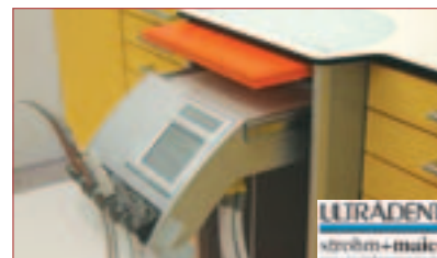
^ Ausziehbares ULTRADENT ZA-Gerät.

ULTRADENT und strohm+maier präsentieren eine neue Wohlfühlpraxis.