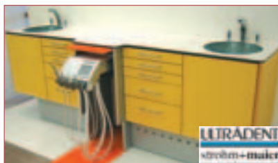
^ preciso HK – faszinierendes Möbeldesign mit Funktion und Innovation.