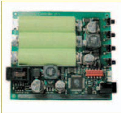
– Hightech-Innenleben der Steuerungseinheit von SARA-LED.