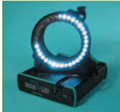
– Durch bewusstes Abschalten bestimmter Bereiche des SARA-LED und somit durch Schattenbildung werden plastischer wirkende Aufnahmen ermöglicht.