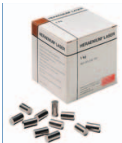
Heraenium eignet sich besonders zum Laserschweißen.

Heraenium® Laser hat einen Kohlenstoffgehalt von weniger als 0,05 Prozent und enthält keine zusätzlichen Nickelanteile. Es lässt sich direkt und ohne Zusatz-