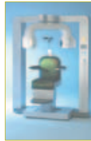
Der neue Volumetomograph 3D Accuitomo von Morita setzt Maßstäbe.

Morita ist mit seinem neuen Volumetomograph-Gerät 3D Accuitomo, was für „Accuracy in Tomographie“ steht, einen besonderen Weg gegangen. 30 Jahre Erfahrung im Großröntgen mit weltweit über 70.000 installierten Röntgengeräten machen sich bemerkbar. Gemäß der Morita Maxime „Komfort und Sicherheit für den Behandler und den Patienten“ hat sie einen Patientenstuhl entwickelt, um den sich, vergleichbar einem Panoramaröntgen, der Sensor um den Patientenkopf dreht. In nur 17 Sekunden werden digitale Daten generiert,