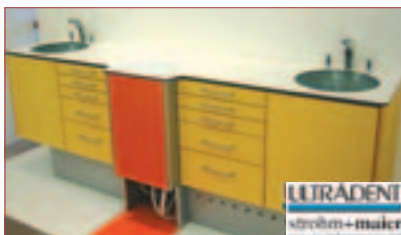
^ Harmonische Verschmelzung von Zahnmedizin, Möbel und Hightech.