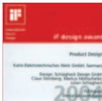
^ iF design award 2004.

Die Jury stellte dieses Jahr einen neuen Trend fest, nachdem gerade die Produkte im Investitionsgüterbereich die größte Innova-