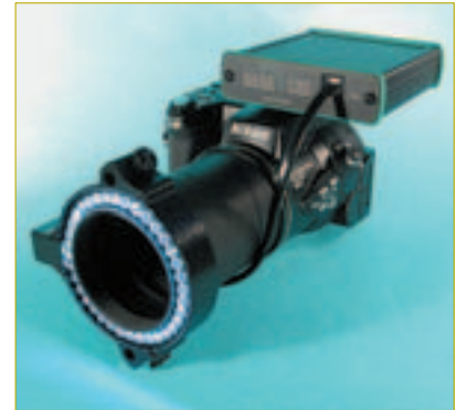
– Beispiel: Nikon COOLPIX 5700/8700 mit SARA-LED.

Nach fast zehnjähriger Erfahrung im Bereich des Vertriebes von diversen Dental-kamerasystemen hat die Firma Ramezani-Sabet Kamerasysteme Nürnberg ein Produkt entwickelt, das die bisher angebotenen LED-Ringlichtsysteme in den Schatten stellt. Bekanntlich kommt es bei der Dental-fotografie auf das richtige Licht an. Die Aus-leuchtung der Mundhöhle wurde in der ana-logen Fotografie von Ringblitzsystemen übernommen, die jedoch in Kombination mit Digitalkameras entweder nicht oder nur erschwert funktionieren. Eine Dauerlicht-quelle mit LED-Technologie ist die Prob-lem-lösung bei der Digitalfotografie.