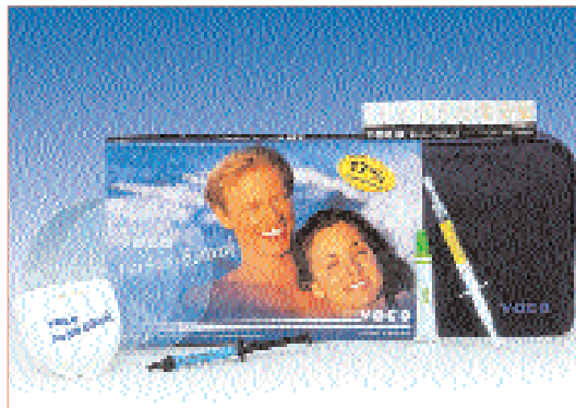
▲ Perfect Bleach – effektiv, dauerhaft und schonend.

Schnell und einfach weiße Zähne: Die Handhabung des modernen Aufhellungs-