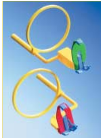
▲ Super-Bite® Senso – der Garant für hochwertige Aufnahmen beim digitalen Röntgen.

diert und wird für Röntgenbilder im Frontzahnggebiet eingesetzt. Super-Bite Senso Posterior ist rot kodiert und ist für Röntgenaufnahmen im Prämolaren- und Molarenbereich indiziert. Super-Bite Senso Posterior ermöglicht, kleine Sensoren sowohl vertikal als auch horizontal zu orientieren, was das direkte digitale Röntgen im schwer zugänglichen Seitenzahnggebiet vereinfacht.