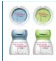
Die optimal auf VITA In-Ceram abgestimmten Verblendkeramiken.

Zur VITA In-Ceram 2000-Produktpalette zählen VITA In-Ceram 2000 AL CUBES und YZ CUBES. Hierbei handelt es sich um dicht sinternde oxidkeramische Gerüstwerkstoffe. Die AL CUBES bestehen aus reinem Aluminiumoxid und werden mit