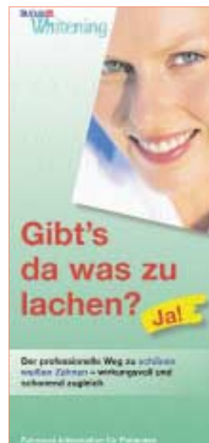
▲ Die achtseitige Patienteninformation unterstützt das Beratungsgespräch und kann auch in der Praxis ausgelegt werden.

mit 7,5 % Wasserstoffperoxid für die häusliche Anwendung in einer Schiene tagsüber.