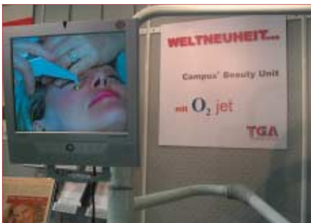
Die Campus® Beauty Unit ermöglicht neben zahnmedizinischen auch kosmetische Behandlungen.

Das OXYjet System basiert auf der einzigartigen Wirkung von gepulstem, konzentrierten Sauerstoff. Reiner Sauerstoff und spezielle kosmetische Wirkstoffe werden