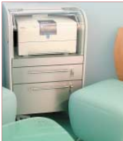
Der CAD/CAM Cube kann gut in das Praxisdesign integriert werden.

Der CAD/CAM Cube ist die mobile Lösung zur Integration einer Cerec-Schleifeinheit in die Praxis. Das moderne Design mit der Frontgestaltung in Holz-/Edelstahl-Kombination mit Edelstahl-Stangengriffen lässt sich gut in das bestehende Praxisambiente einfügen. Neben der optisch ansprechenden Verpackung des Cerec-Schleifge-