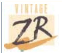
Vintage ZR – ein Verblendkeramiksystem für alle erhältlichen Zirkonoxid-Gerüstsysteme.

Neben den werkstoffspezifischen Vorteilen wurden die VINTAGE ZR Keramikmassen für eine rationelle Arbeitstechnik konzipiert. Diese erreichte man durch eine besonders feine und homogene Partikelstruktur der ZR Opaque-Dentine und