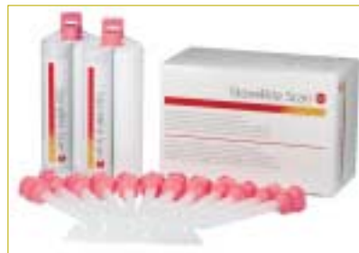
▲ „StoneBite Scan“ – das scanbare Bissregistriermaterial für höchste Ansprüche.

Die vom zu Grunde liegenden Produkt „StoneBite“ bekannten guten Eigenschaften wurden für die scanbare Version über-