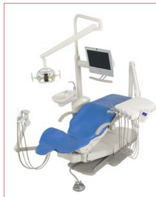
▲ a-dec 500 vereint modernes Design und Funktionalität.

Fordern Sie noch heute die Unterlagen zu diesem innovativen Arbeitsplatzkonzept bei ULTRADENT oder bei Ihrem Dental-Fachhändler an. Weitere Informationen finden Sie auch im Internet unter: www.ultradent.de