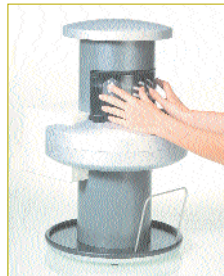
* Hohe diagnostische Qualität von VistaScan in Studien bewiesen.

Zwei neue Universitätsstudien bestätigen einmal mehr die hohe diagnostische Qualität des Speicherfolien-Systems VistaScan von Dürr Dental. Dabei stehen die Diagnosesicherheit und der zuverlässige Einsatz im Praxisalltag im Vordergrund. So zeigt eine Studie der ACTA Amsterdam, dass einzig die Lichtschutzhüllen von Dürr Dental wirksam gegen Lichteinstrahlung abschirmen. Licht löscht die gespeicherte Bildinformation und reduziert die diagnostische Sicherheit. Dänische Wissenschaftler, die menschliche Kiefergelenke mit drei verschiedenen Röntgenaufnahmesystemen untersuchten, fanden heraus: Mit VistaScan lassen sich Kondylen-Abflachungen und Kondylen-Schädigungen ebenso