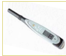
* Flipover und Amortisationsrechner für den KaVo DIAGNodent pen erhältlich.

Der Amortisationsrechner (im Internet unter www.kavo.com/calc ) verdeutlicht, welche Auswirkungen die Verstärkung der Prophylaxe und der Einsatz moderner Methoden für die Kariesfrüherkennung für die Praxis haben. Entwickelt wurde der Amorti-