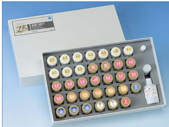
^ Vintage ZR – ein Verblendkeramiksystem für alle erhältlichen Zirkonoxid-Gerüstsysteme.

Natürlich setzen wir auch in diesem Keramiksystem auf unsere bekannten OPAL-Inzismassen. Mit der Anwendung der VIN-