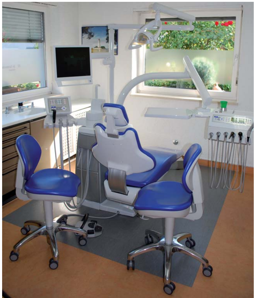
▲ Das Behandlungszimmer von Dr. Schleenbecker mit der ESTETICA E70 (KaVo).

In Hinblick auf die Rückenlehne hat er sich für die Progress-Rückenlehne entschieden, die schmäler ausfällt als die Comfort-Lehne und dadurch aus seiner Sicht einen noch besseren Zugang zum Patienten erlaubt. Die Einhand-Bedienung der pneumatischen 2-Gelenk-