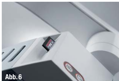
▲ Abb. 5: Ansicht der Wurzelkanäle auf dem Monitor. ▲ Abb. 6: Auf der SD-Karte werden die Bilder und/oder Filme gespeichert.

lare ist gut, was sicher auch der LED-Beleuchtung geschuldet ist. Die Okulare enthalten ein absolutes Highlight: Eine stufenlose Winkelnivellierung für die Betrachtung, die eine Schrägstellung des Mikroskopkopfes bei gerade stehenden Okularen ermöglicht, ähnlich dem MORA-Interface von Zeiss.