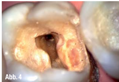
▲ Abb. 3 und 4: Blick durch das Mikroskop auf die Wurzelkanäle.

am Gerät anstößt. Darüber hinaus wird das Arbeitsfeld für alle übersichtlicher, die Patientenlagerung einfacher und eine ergonomische Sitzposition von Assistenz und Behandler oft erst dann möglich. Das Leica M320 bietet in dieser Hinsicht eine Auswahl an Objektiven, die einen individuellen Arbeitsabstand erlauben.