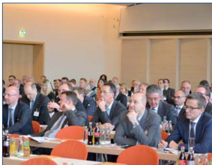
▲ Die BVD-Fortbildungstage 2013 fanden im Estrel Hotel in Berlin statt.