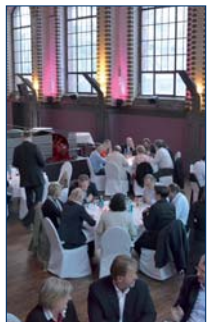
▲ Das alte Wasserwerk bildete den stimmungsvollen Rahmen der Abendveranstaltung.