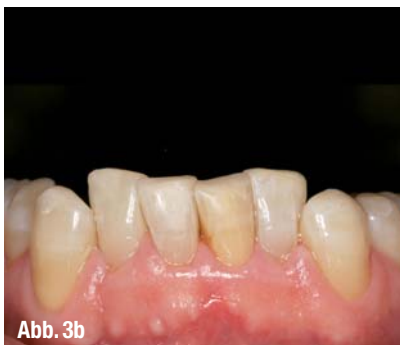
▲ Abb. 1a und b, 2a und b, 3a und b: Vorher-Nachher-Situationen.

In unserer Praxis hat sich gezeigt, dass zunächst die Behandlung der abradieren Unterkieferfront sinnvoll und von den allermeisten Patienten nach spätestens ein bis zwei Tagen adaptiert ist.