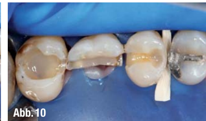
▲ Abb. 6: Exkavierte Situation der Zähne 25–27 unter Kofferdam mit angelegter partieller Matrize mesial an Zahn 25. ▲ Abb. 7: Palatinalansicht der exkavierten Situation der Zähne 25–27. ▲ Abb. 8: Total-Etch-Verfahren der exkavierten Situation mit blauem Ätz-Gel. ▲ Abb. 9: Konditionierte Kavitäten der Zähne 25–27 mit Bonding. ▲ Abb. 10: Aufgebaute mesiale Randleiste an Zahn 25 nach Entfernung der partiellen Matrize sowie Unterfüllung mit Flow-Composit an Zahn 27.

gute Methode, dieser erhöhten Zahn- beweglichkeit zu begegnen. 13