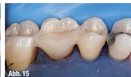
▲ Abb. 11: Die Entnahme von F-Splint-Aid aus der lichtgeschützten Aufbewahrungsflosche mittels Pinzette. ▲ Abb. 12: Längenangepasstes Glasfaserband F-Splint-Aid Slim mit Applikationsspanne zwischen den Zähnen 26 und 27. ▲ Abb. 13: Mit Flow-Composit fixiertes Glasfaserband F-Splint-Aid Slim in den Kavitäten der Zähne 25–27. ▲ Abb. 14: Fertig ausgearbeitete Kompositrestaurationen der Zähne 25–27 mit integrierter Glasfaserschienung. ▲ Abb. 15: Palatinalansicht der restaurierten Zähne nach Schienung mit F-Splint-Aid Slim.