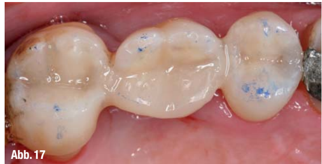
▲ Abb. 16: Okklusalansicht der Zahnschienung nach Entfernung des Kofferdams. ▲ Abb. 17: Durch Blaupapier eingefärbte Kontaktpunkte der restaurierten Zähne. Der wurzelamputierte Zahn 26 hat eine in orovestibulär reduzierte Kaufläche mit ausschließlich statischem Kontakt auf den bukkalen Dreieckswülsten zur Vermeidung von Scherkräften.