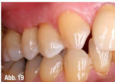
▲ Abb. 18: Palatinalansicht der ausgearbeiteten Restaurationen. ▲ Abb. 19: Bukkalansicht nach Zahnschienung in Interkuspitation.

Parodontaltherapie eines Patienten mit generalisierter, schwerer chronischer Parodontitis und Diabetes mellitus Typ II veranschaulicht.