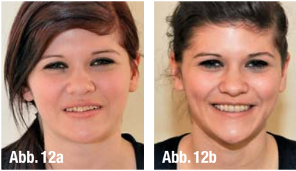
▲ Abb. 12a und b: Vorher-Nachher-Vergleich.

Malfarben zur Restauration erfolgte mittels Polymerisationsprozess. Für eine Oberflächenversiegelung ist die chemische Glasur VITA ENAMIC GLAZE erhältlich. Eine Brandführung ist bei Verwendung der neuen Hybridkeramik grundsätzlich nicht erforderlich.