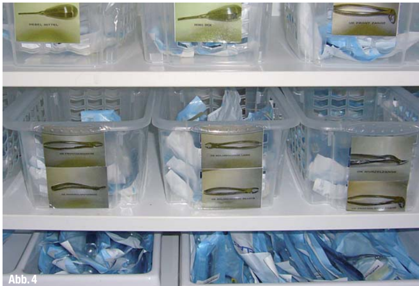
▲ Abb. 4: Chirurgieschrank mit Fotos zur Instrumentensortierung als Ergebnis des Verbesserungsprozesses in der Praxis Dr. Müller.

dung und Einarbeitung neuer Mitarbeiter bedacht werden. Selbst wenn viele Mitarbeiter die Instrumentenaufbereitung zufriedenstellend beherrschen und deshalb keine Hilfsdokumente benötigen, so ist dieser Bereich für eine Auszubildende oder einen neuen Mitarbeiter ein sehr umfangreicher Prozess, der in der Anfangsphase auch die anderen Teammitglieder durch häufiges Nachfragen oder durch auftretende Fehler belastet.