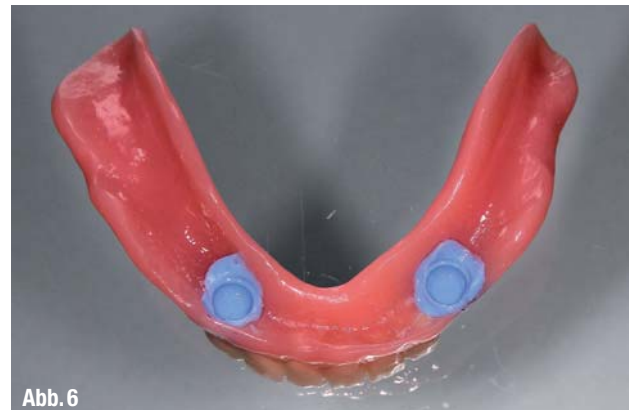
▲ Abb. 2: Ausgangssituation und Ausmessen der Gingiva-Höhe für die korrekte Locator-Höhe. ▲ Abb. 3: Einsetzen der ausgewählten Locator-Abutments in die OsseoSpeed TX-Implantate. ▲ Abb. 4: Aufgesetzte Resilienz-Platzhalter und Metallmatrizen. ▲ Abb. 5: Positionsbestimmung mit Filzstift für den „Abklatsch“ in der Prothesenbasis. ▲ Abb. 6: Kontrolle des benötigten Freiraums in der Prothesenbasis mit Fit Test C & B.

die Locator-Sekundärteile auf gleicher horizontaler Höhe liegen.