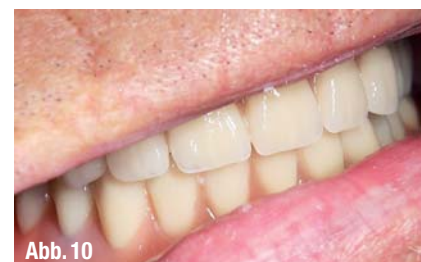
▲ Abb. 7: Abdecken des Abutments Regio 33 vestibulär mit Fit Test C & B. ▲ Abb. 8: Auftragen des Quick Up-Adhäsivs in die vorbereiteten Öffnungen. ▲ Abb. 9: Befüllen der Öffnungen zu je zwei Dritteln mit dem selbsthärtenden Quick Up. ▲ Abb. 10: Eingesetzte Prothese im Schlussbiss.