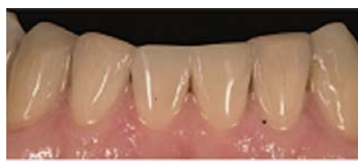
▲ Abb. 2: Beispiel für eine Frontzahnbehandlung mit ceram.x: Die stark geschädigte Unterkieferfrontzahnreihe wurde mit ceram.x A3 von 32 bis 43 wiederhergestellt.