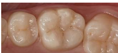
▲ Abb. 1: Beispiel für eine Seitenzahnfüllung mit dem neuen ceram.x: Zahn 36 mit okklusaler Kariesläsion wurde mit ceram.x A2 ästhetisch versorgt.