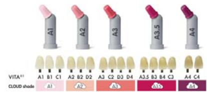
▲ Abb. 4: Die Zuordnung im CLOUD-Konzept: Fünf Farben decken das gesamte VITA 2 Classic-Spektrum ab.

Die Füllungstherapie unter Verwendung von Kompositen ist seit vielen Jahren etabliert. Da sie einen Großteil des zahnärzt-