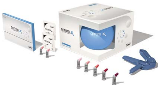
▲ Abb. 5: Zur Markteinführung die Starterpackung mit 24 Compules in allen fünf Farben zusammen mit einem „Discovery-Kit“ zum risikofreien Ausprobieren.

Erst recht wird das Team von einem so großen Fortschritt profitieren, wie ihn die SphereTEC-Technologie darstellt. Die dadurch entstandene neue ceram.x-Generation erleichtert den zahnärztlichen Alltag durch wesentliche Handhabungsvorteile. Dazu zählen das einfache Adaptieren an die Kavitätenflächen, ohne am Modellierinstrument zu kleben, das präzise Modellieren und Ausformen bei hoher Standfestigkeit, die feste Konsistenz bei gleichzeitig leichtem Ausbringen aus der Compule sowie die schnelle Politur mit (hoch-)glänzendem Ergebnis. Die VITA 2 -Classic-Farben werden dank des neuen CLOUD-Konzepts vollständig abgedeckt – und das mit nur fünf Farben von A1 bis A4. Die Erweiterung auf indirekte Restaurationen ist dabei ein weiterer Aspekt, der den Anspruch der neuen ceram.x-Generation als universelles Füllungsmaterial unterstützt (Abb. 5).