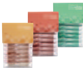
trèswhite supreme in gebrauchsfertigen KombiTrays

Von Ultradent Products, dem Marktführer auf dem Gebiet der Zahnaufhellung: