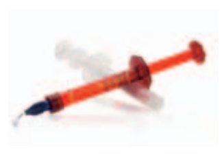
Opalescence Boost schnell in der Praxis

Die Gele mit der patentierten PF-Formel sind in der Lage, dank ihres Gehaltes an Kaliumnitrat und Fluorid die Kariesresistenz des Schmelzes zu stärken.