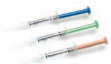
Opalescence PF bequem in individueller Tiefziehschiene