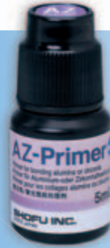
6-MHPA-Monomer im AZ-Primer