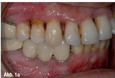
Abb. 1a–e _ a–c: Intraorale Aufnahmen in Okklusion nach der Parodontalbehandlung (Initialphase). Eine deutliche Rezession an allen Zähnen ist deutlich zu sehen. d: Oberkieferaufsicht, Zahnfehlstellungen und lückige Front, palatale Gingivarezessionen. e: Unterkieferaufsicht, Gingivarezessionen an der Unterkieferfront.

Die Patientin stört sich an ihrer Zahnstellung und den Lücken in der Front. Dies stellte für die Patientin neben der funktionellen (erschwerter Lippen-