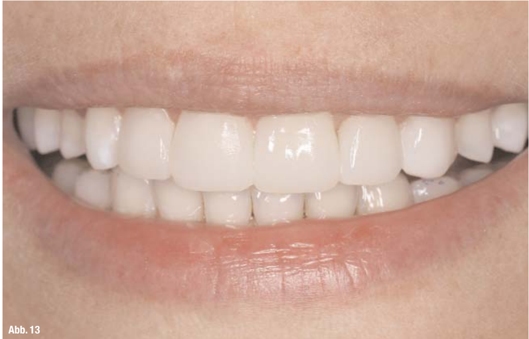
Abb. 13 _ Deutlich verbesserter Gesamteindruck der Patientin beim Lächeln.