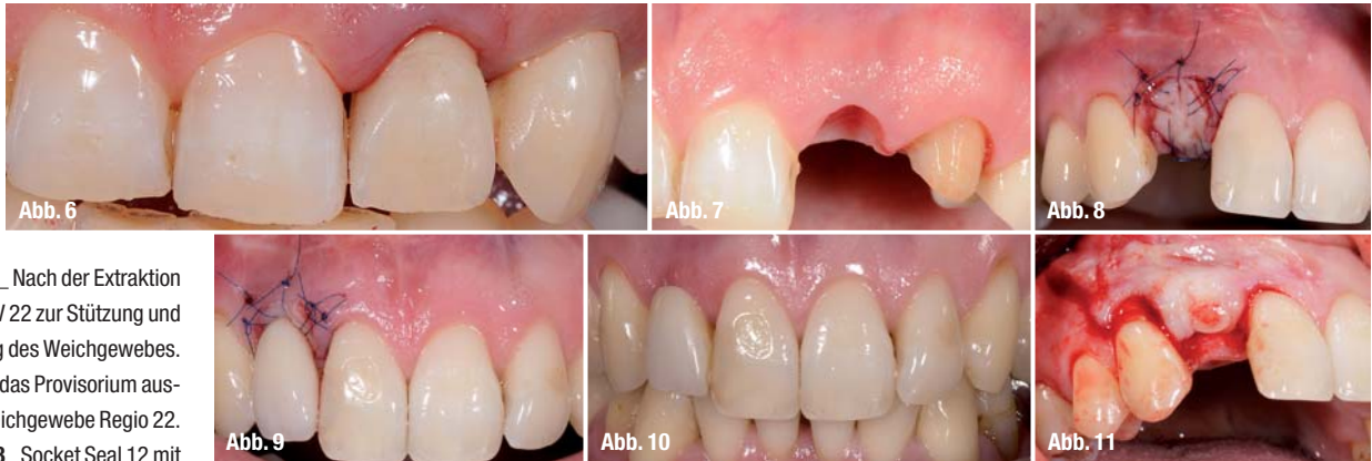
Abb. 6 Nach der Exztraktion eingesetzt PV 22 zur Stützung und Ausformung des Weichgewebes.