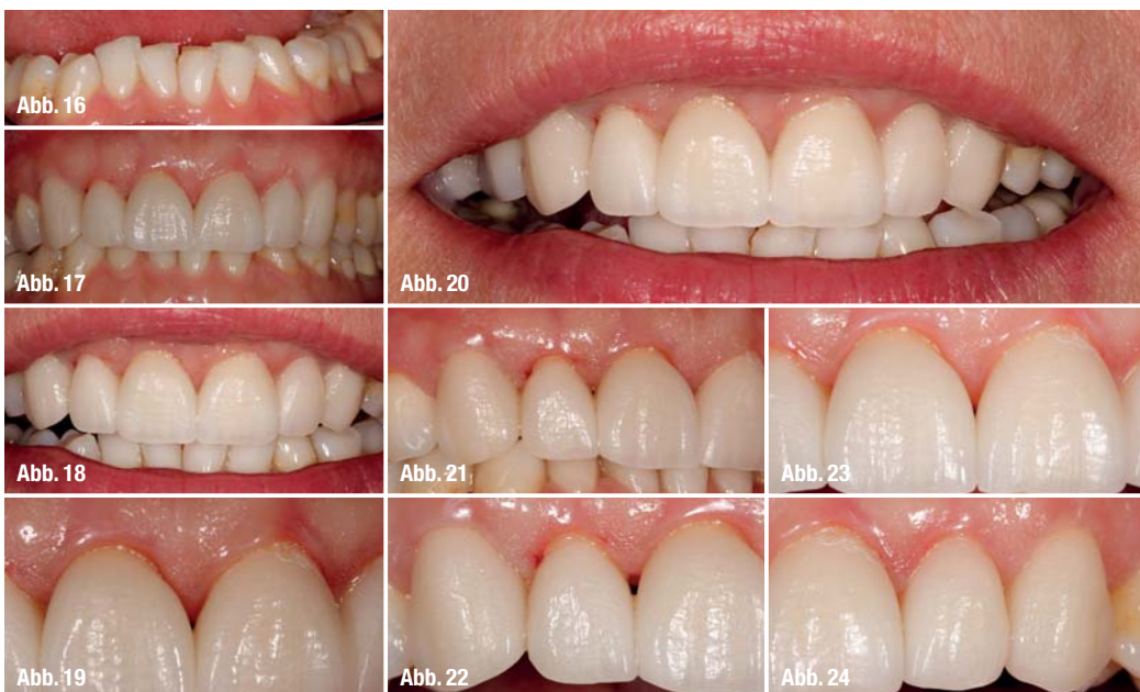
Abb. 16_ Detailaufnahme der UK-Front als Hilfe zum Schichten. Abb. 17-19_ Rohbrandeinprobe, Kronen in situ. Abb. 20_ Farbeindruck mit Einbezug der Lippen. Abb. 21-24_ Kontrolle der Interdentalpapillen.

alle Richtungen gestreut und strahlt somit auch von „innen“ auf die Papillen zurück (Abb. 4c und d). Der zweite Grund für Verfärbungen der Gingiva bei angrenzenden Metallkeramikronen ist, dass sich Metalloxide aus den unedleren Metallen der Legierung herauslösen und in das angrenzende Weichge-