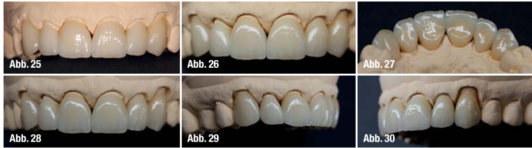
Abb. 25–30_ Die fertigen Kronen auf dem Kontrollmodell.

webe diffundieren. Je unedler die Legierung, desto wahrscheinlicher sind auch entsprechende Verfärbungen.