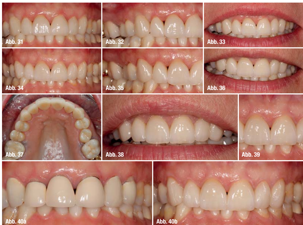
Abb. 40a und b_ Vorher-Nachher-Situation im Vergleich.