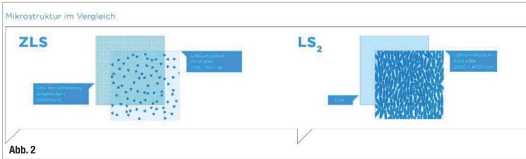
Abb. 2_ Schematische Darstellung des unterschiedlichen Gefügeaufbaus von zirkonoxidverstärkten (ZLS) und Lithiumdisilikatkeramiken. (LS 2 )