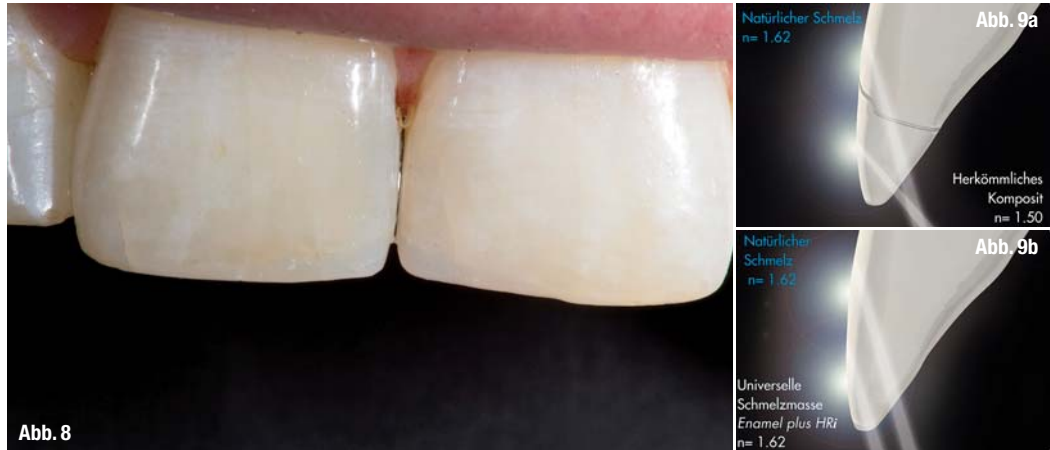
Abb. 9 a und b: _Der Lichtbrechungsindex von Enamel plus HRI entspricht dem des natürlichen Schmelzes.

Die Lichtbrechung sowie -reflexion und die ästhetische Wirkung entsprechen dem des natürlichen Zahnes. Die so versorgten Patienten sind in den meisten Fällen sehr zufrieden und dankbar, dass wir eine Alternative zum Keramikveneer oder gar einer Überkronung vorgeschlagen haben. Das heißt nicht, dass Keramikversorgungen nicht mehr gebraucht werden; ganz und gar nicht. Nur: das Indikationsspektrum für Kompositrekonstruktionen hat sich erheblich erweitert, ganz abgesehen von der Bequemlichkeit sowie dem Kosten-Nutzen-Aufwand für den Patienten und nicht zuletzt den Verdienstmöglichkeiten für den Zahnarzt. Das Komposit Enamel plus HRI ist der bisher einzige Vertreter einer neuen Klasse hochästhetischer Restaurationsmaterialien. Das Besondere und Einzigartige liegt in der Angleichung des Lichtbrechungsindex an den Wert des natürlichen Schmelzes, er beträgt 1,62 (Abb. 9a und b).