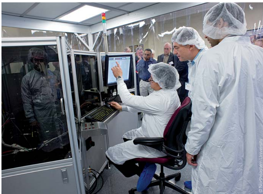
Wissenschaftler während der Arbeit mit dem „Nanoscale Offset Printing System (NanoOps)“.