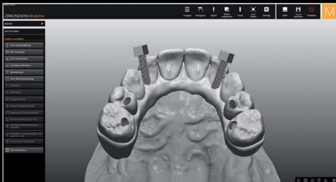
Erstellen von Schraubenkanälen mit Gewinden

Weitere Informationen und Videos: www.zirkonzahn.com