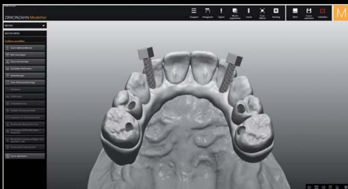
Erstellen von Schraubenkanälen mit Gewinden

Weitere Informationen und Videos: www.zirkonzahn.com