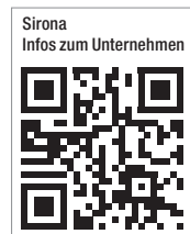
Sirona Infos zum Unternehmen

In DVT-Systeme integrierte Gesichtsscanner bieten bei kieferorthopädischen sowie bei mund-, kiefer- und gesichtschirurgischen Behandlungen eine Reihe von Vorteilen. Zum einen kann der Behandler die Gesichtsaufnahmen bei der Behandlungsplanung, -durchführung und -dokumentation einsetzen. Zudem gibt die 3D-Darstellung kurz vor oder auch während der Operation noch einmal eine gute Orientierung. Die Aufnahme des Patientengesichts kann darüber hinaus als Dokumentation des Behandlungsverlaufs sowie als Vorher-Nachher-Vergleich der klinischen und ästhetischen Situation eingesetzt werden. Dem Patienten erleichtert sie das Verständnis von geplanten Behandlungsmaßnahmen.