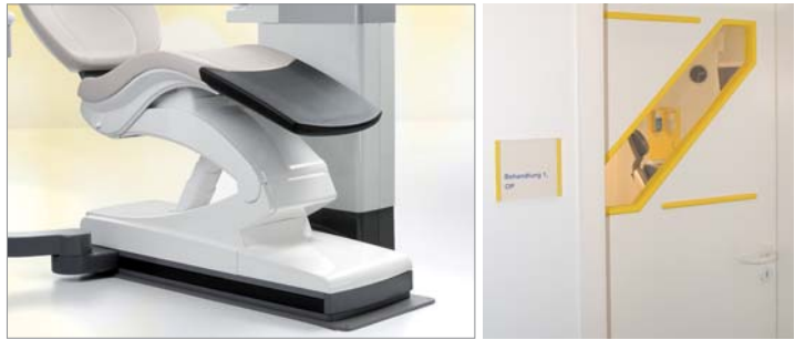
Abb. 2: Die neue Stuhlbasis lässt Platz für den Einstieg und ermöglicht eine Höhenverstellbarkeit von 370 bis 820 Millimeter. – Abb. 3: Mit einem Sichtspalt in der Tür jedes Behandlungszimmers verhindern wir, dass Behandler und Assistenz mit dahinterstehenden Senioren zusammenstoßen.

Manchmal sind es aber auch einfache kleine Hilfsmittel, die eine Praxis seniorengerecht machen. Wir haben bei uns beispielsweise die Tür jedes Behandlungszimmers mit einem Sichtspalt ausgestattet (Abb. 3). Das soll ver-