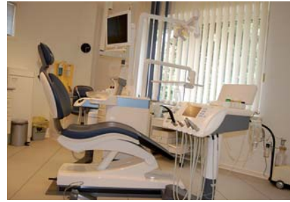
Abb. 1: Die Behandlungseinheit TENEEO bietet älteren Patienten einen bequemen Einstieg und eine stabile und komfortable Lagerung.

Bei uns werden Senioren grundsätzlich im Erdgeschoss unserer zweigeschossigen Praxis behandelt. Unsere beiden Behandlungszimmer auf dieser Etage sind die größten in der Praxis. Das kann bei der Behandlung von älteren Menschen aus zwei Gründen von Vorteil sein: Zum einen, wenn der Patient im Rollstuhl sitzt und Platz zum Rangieren benötigt, zum anderen, wenn er, wie schon erwähnt, eine Begleitung mitbringt. Diese kommt in der Regel mit zur Behandlung und braucht dort natürlich auch einen Platz. Bei der Behandlung selbst spielen Gestaltung und Ausstattung der Behandlungseinheit eine maßgebliche Rolle, wenn es darum geht, dass