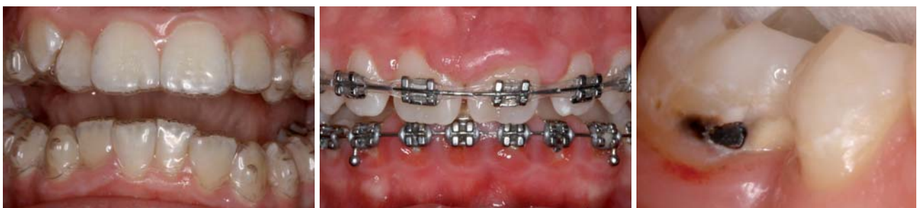
Abb. 1: Patient mit eingesetzter Invisalign-Schiene. – Abb. 2: Hyperplasie im Ober- und Unterkiefer während der Behandlung mit klassischen Bracketsystemen. – Abb. 3: Vestibuläre Karies nach Entfernung des Molarenbandes bei einer klassischen Bracketbehandlung.

Die kieferorthopädische Behandlung mit herausnehmbaren Schienen hat einen eindeutigen Vorteil in Bezug auf die Hygienisierbarkeit (Chenin et al. 2003). Eine Speichelzirkulation innerhalb der Schiene ist auch während