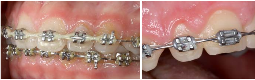
Abb. 4: Plaquebildung im Zahnalsbereich und zirkulär im Bereich der Brackets. – Abb. 5: Plaquebildung an Brackets und Zähnen mit beginnender Gingivitis und Gingivahyperplasie.

der Tragezeiten sichergestellt und verhindert so unerwünschte Demineralisationseffekte (Boyd 2008).