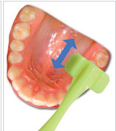
Abb. 3 und 4: Spezielle Zahnbürsten erleichtern die Zahnpflege auch dem alternden Patienten mit eingeschränkten motorischen Fähigkeiten.

zeigen, dass die junge zahnärztliche Assistenz den an Lebenserfahrungreichen Senior nur schwer erreichen wird, wenn es darum geht, Defizite anzusprechen und die Notwendigkeit einer ausreichenden Mundhygiene darzulegen. Der Umgang mit dem Alter erfordert überdies Kenntnisse allgemeinmedizinischer Erkrankungen und deren Medikation, die in der Folge enorme Auswirkungen auf die Mundhöhle haben können. Eine Altersdiabetes kann zu verringerter Immunabwehr und Veränderungen in der Durchblutung der Schleimhaut führen, vorliegende Herz-Kreislauf-Erkrankungen und deren medikamentöse Therapie gehen oft einher mit Gingivahyperplasie und/oder veränderter Blutungsneigung, die Auseinandersetzung zum Beispiel mit einem Marcumarpass und hier den aktuellen Gerinnungswerten oder dem Herzpass gehören also sicher in die Hand von Behandlerin oder Behandler und fortgebildetem, vielleicht sogar spezialisiertem Personal.