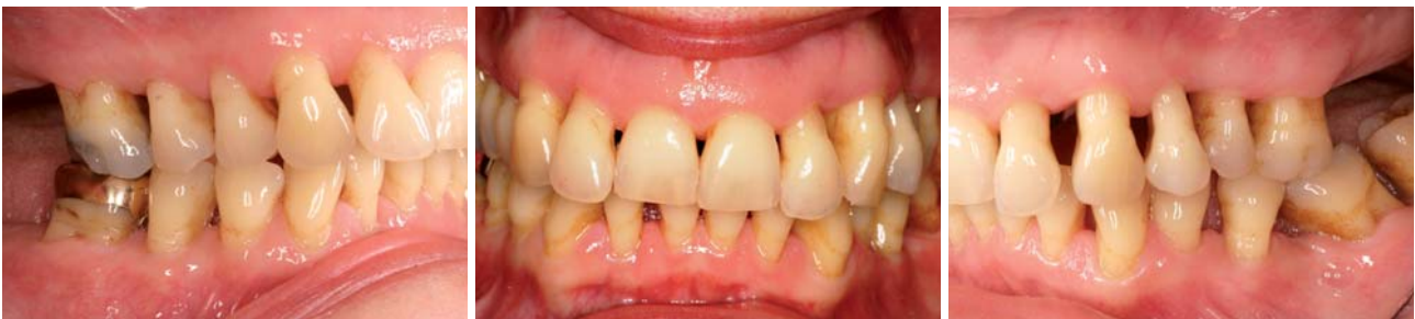
Abb. 1–3: 53-jährige, weibliche Patientin mit Verdacht auf eine aggressive Parodontitis, ist nach neun Jahren im regelmäßigen Recall (4x jährlich) mit guter Compliance.

Um mögliche irreversible Folgen zu vermeiden, muss eine Parodontitis frühzeitig erkannt werden. Risikofaktoren müssen innerhalb eines parodontalen Risikomanagements evaluiert und hinsichtlich ihrer möglichen gesundheitsschädlichen Auswirkungen bewert-